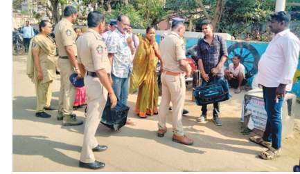
చెక్పోస్టు వద్ద సిబ్బంది తనిఖీ చేస్తారు. అయినప్పటికీ గంజాయి తరలింపు వివిధంగా సాగుతుండే విధిమీదే దాద్ర ప్రశ్నగానే మారింది. చెక్పోస్టుల వద్ద సిబ్బంది నిర్లక్ష్యమా? లేకుంటే వారిలో కొందరికి కాసులు అందుతున్నాయో అన్నది పోలీసు జిల్లా ఉన్నతాధికారులు నిఘా పెట్టాలిస్తుంది. అలాగే రైలు, బస్సుల్లోనూ గంజాయి రవాణా సాగుతోంది. గతంలో ట్రాన్స్మిగ్రేషన్ కార్యాలయాల ద్వారా గంజాయి తరలింపు పట్టుబడిన విషయం తెలిసింది. జిల్లా పోలీసు అధికారులు గంజాయి రవాణాపై ఉక్కుపాదం మోస్తామని చెబుతున్నారని, అది కనిపించినా అమలుయ్యదా మాన్సే తప్ప గంజాయి తరలింపుకు ఆర్థుకట్ట పడే అవకాశం లేదన్న అభిప్రాయం వినిపిస్తోంది.

అంధ్రా సరిహద్దు ప్రాంతాలైన ఇద్దాపురం, మెలియాపుట్టి, పాతపట్నం, బత్తిలి, కొత్తూరు మండల లాలు మీదుగా గంజాయిని తరలిస్తున్నారు. చెక్పోస్టుల వద్ద ప్రతి ఒక్క వాహనాన్ని