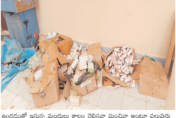
ఉండడంతో ఇస్తున్న మందులు కాలం చెల్లినవా మంచివా అంటూ పలువురు