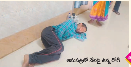
ఆసుపత్రిలో నేలపై ఉన్న రోగి