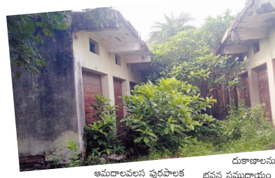
అమడాలపలస పురపాలక సంఘం పరిధిలోని మెట్లకొత్తపలసలో 1999లో

నిర్మాణం పూర్తి అయిన వాణిజ్య భవన సముదాయం భవనాలు నేటికీ ప్రారంభానికి నోచుకోలేదు. చిన్న మెట్ల తరగతి వట్టణాల అభివృద్ధి కార్యక్రమంలో భాగంగా వీటిని నిర్మించారు. ఇందులో మొత్తం 101 దుకాణాలను నిర్మించారు. ఇంతటి విలువైన భవన సముదాయం పాలకులు, అధికారులు నిర్లక్ష్యం కారణంతో ప్రారంభానికి నోచుకోలేకపోవడంతో