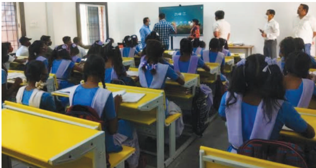
ప్రాంతాలకు సర్దుబాటు చేయవచ్చని పేర్కొన్నారు.

పాఠశాలల్లో గత నెల జూలై 31 వాటికి ఉన్న వాటికి భారీగా చూపారు. ఉపాధ్యాయుల సర్దుబాటుకు 117 జీవోలోని విధి విధానాలనే పాటించాలని కమిషనర్ సూచించారు. ఈ ప్రక్రియను త్వరితగతినే పూర్తిచేయాలని కమిషనర్ ఆదేశాలు జారీ చేశారు. పని సర్దుబాటు ప్రాధాన్యతలు ఇవే... ఉపాధ్యాయుల పని సర్దుబాటు ప్రాధాన్యతలను కమిషనర్ తన మార్గదర్శకాలలో వివరిస్తూ ఉన్నత పాఠశాలల్లో అన్ని సబ్జెక్టులకు కొరత లేకుండా చేసేందుకు కొలి ప్రాధాన్యత ఇచ్చారు. సాధారణంగా ప్రాథమిక, ఉన్నత పాఠశాలలో 98 మందికి తక్కువగా విద్యార్థులు ఉంటే ఒకటి, రెండు తరగతులకు వేరుగా, మూడు నుంచి ఎనిమిదవ తరగతి వరకు వేరుగా ఉపాధ్యాయులను కేటాయించున్నారు. అన్ని పాఠశాలలకు ఎక్స్ డిటిలను సర్దుబాటు చేయగా ఇంకా మిగిలితే వారిని ఏకోపాధ్యాయ పాఠశాలకు పంపకారు. మినహాయింపు.. 2025 ఏప్రిల్ 30వ తేదీలోపు ఉద్యోగ విరమణ చేయనున్న ఉపాధ్యాయులను పని సర్దుబాటు నుంచి మినహాయింపు ఇచ్చారు. 100 శాతం అంధత్వం ఉన్న ఉపాధ్యాయులను కూడా మినహాయింపులోకి కలిపారు. ఇంకా ప్రభుత్వ ఉన్నత పాఠశాల షఫ్ ఇంటర్ ఉన్న పాఠశాలలను సర్దుబాటు ప్రక్రియ నుంచి తప్పించారు. విశతంపులు, అవిహితలు, చట్టబద్ధంగా విదాకులు తీసుకున్న ఉపాధ్యాయులు, స్కూల్ ఉన్నవాటికి సైతం మినహాయింపు ఉంటుంది. ఒకేవేళ వీరు ఇంటి కోరుకుంటే పని సర్దుబాటుకు అనుమతిస్తారు. విజిల్స్ ప్రాంతాల్లో పని చేస్తున్న ఉపాధ్యాయులను వైదాన