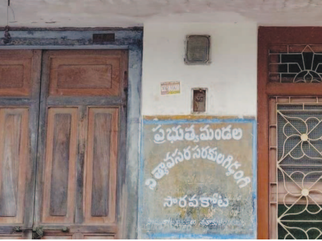
బజ్జెల నుంచి మూసి ఉన్న నిత్యావసర సరుకుల గిడ్డంగి

గిడ్డంగిని ఎత్తివేసి, 20 కిలోమీటర్ల దూరంలో ఉన్న జలుమూరులో కలప డంకో ఈ ప్రాంత డీలర్లకు అసౌకర్యం ఏర్పరుతుంది అనేవేదన వ్యక్తం చేశారు. ఆ గిడ్డంగిని మళ్లీ ఇక్కడే ఏర్పాటు చేయాలని వారు కోరారు.