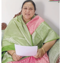
ప్రభుత్వంపై మండిపడ్డారు. ఒక

పనికి రాకుండా ఈ సభలు జరిగాయన్నారు. ఒకేరోజు గ్రామ సభల నిర్వహణతో ఉపాధి హామీ అధికారులు లండనూ ప్రతి గ్రామ సభకు హాజరు కాలేకపోయాడన్నారు. డి.కె ప్రజల నుంచి ఆయా గ్రామాల సమస్యలు తెలుసుకునే దిశగా ముందడుగు వదలేదన్నారు. గ్రామసభలు నిర్వహించి గ్రామాల్లో పనులు చేయాలనే ఆలోచన జూరస్పెన్షులోకి, సమయం లేకుండా.. గందరగోళంగా.. తూతూమంత్రింగా గ్రామ సభల నిర్వహించడంపై ఆమె