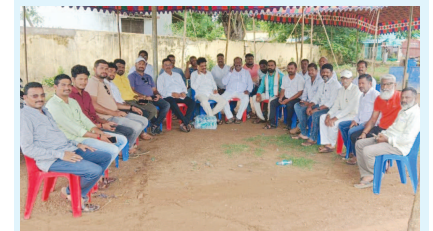
విలేజులలో చూట్లాడుతున్న యాదవ సమితి నాయకులు

వలాస, ఆగస్టు 25 (వార్త): కాశీబుగ్గ రైల్వే గ్రౌండ్ ప్రాంగణంలో సోమవారం శ్రీకృష్ణ జన్మాష్టమి వేడుకలు నిర్వహిస్తున్నారని వలాస యాదవ సేవసమితి తెలిపింది. ఆదివారం వారు విలేజులలో మాట్లాడారు. ఈ వేడుకల్లో ప్రతి ఒక్కరూ పాల్గొని కృష్ణ భగవానుని అనుగ్రహం పొందాలని వారు కోరారు. ఈ వేడుకలను విజయవంతం చేయాలని విజ్ఞప్తి చేశారు.