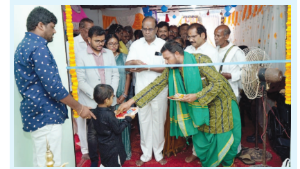
ఆసుపత్రిని ప్రారంభిస్తున్న డాక్టర్ రాజ్