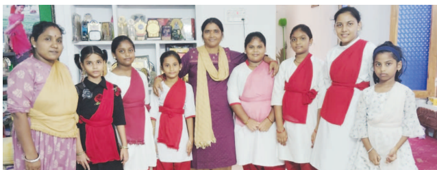
శ్రీసాయిమెహర్ స్వత్రకళానికేతన నాట్య బృందం