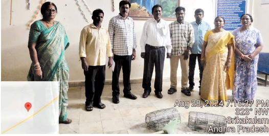
ఆగస్టు 28, 2024 7:16:47 PM 32°3' NW Srikakulam Andhra Pradesh పారిశుధ్య నిర్వహణపై ఇప్పటికే తగు ఆదేశాలు జారీ చేశారు. ఎలుకల కరచంద్రంతో సైనిక ప్రాంతీయ అనువంశిత ప్రధమ చికిత్స తీసుకున్న వారి ఆరోగ్య పరీక్షించి జిల్లా కలెక్టర్ ఆడిగి తెలుసుకున్నారు.