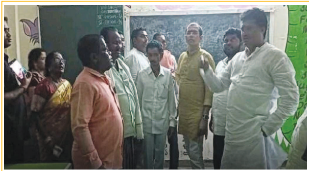
సారవకోట మండలం సవరణ బౌతం అక్రమ పాఠశాలలో అధికారులతో మాట్లాడుతున్న ఎస్సీ కమిషన్ సభ్యుడు శంకర్ నాయక్

-రాష్ట్ర ఎస్సీ కమిషన్ సభ్యుడు పడిత్య శంకర్ నాయక్