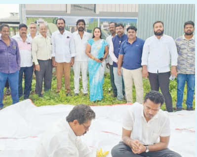
భూమిపూజ చేస్తున్న రోటరీ క్లబ్ ప్రతినిధులు