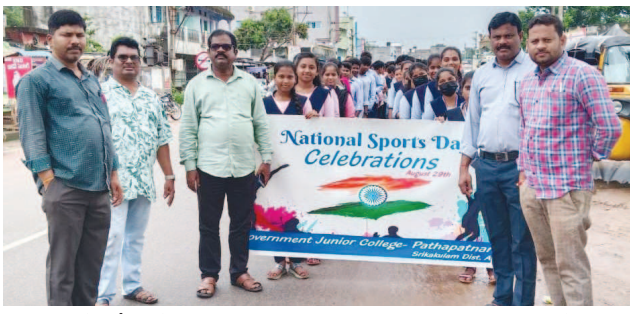
సందర్భంగా జాతీయ క్రీడా దినోత్సవం సందర్భంగా ఆమె మాట్లాడుతూ జరిచినది, సంపూర్ణ ఆరోగ్యాన్ని కలిగి ఉండాలని సూచించారు.