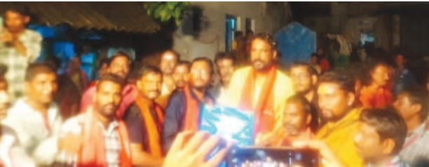
ఉట్ల సంబరం నిర్వహిస్తున్న యూవలలు