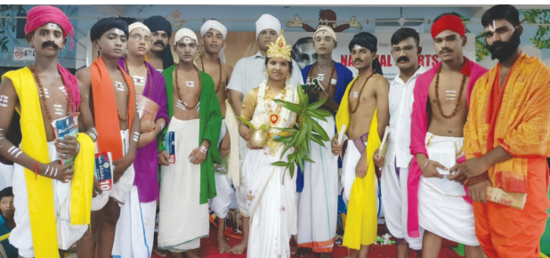
కుంటికోటలో కె.నారాయణ హైస్కూల్లో ఆకట్టుకున్న తెలుగుకవుల వేషధారణ