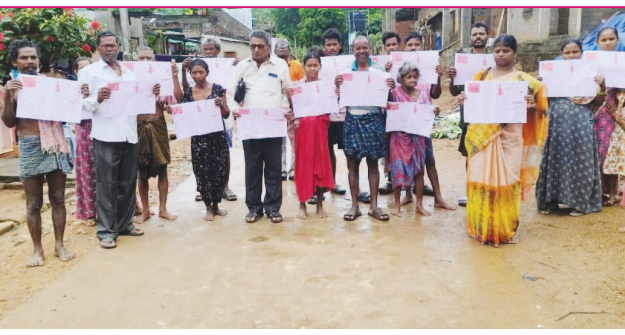
ఆదివాసి గ్రామాల్లో ప్రచారం నిర్వహిస్తున్న ఏపిఆర్ఎస్ నాయకులు