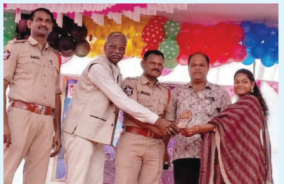
విద్యార్థిని అభినందిస్తున్న సీఐ, ఎస్ఐ