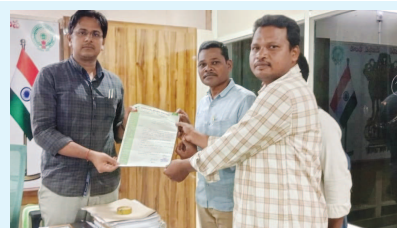
అర్జీవో భరత్ నాయకుడు విశాలపాపం ఇమ్మన్న అధివాసి నేతలు