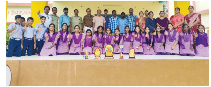
కొత్తపల్లిలో ప్రతిభ చూపిన విద్యార్థులకు అభినందన

మండలం, సెప్టెంబరు 14 (వార్త): హరిపురం, కొత్తపల్లి జిల్లా పరిషత్ ఉన్నత పాఠశాలకు చెందిన విద్యార్థులు క్విజ్ పోటీల్లో ప్రతిభ చూపారు. వాసుడేవపరంలో జరిగిన ఈ పోటీల్లో జిల్లా