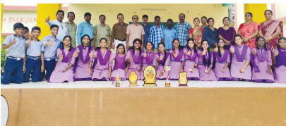
హరిపురంలో విద్యార్థులను అభినందిస్తున్న ఉపాధ్యాయులు

మండలం, సెప్టెంబరు 14 (వార్త): హరిపురం, కొత్తపల్లి జిల్లా పరిషత్ ఉన్నత పాఠశాలకు చెందిన విద్యార్థులు క్విజ్ పోటీల్లో ప్రతిభ చూపారు. వాసుడేవపరంలో జరిగిన ఈ పోటీల్లో జిల్లా