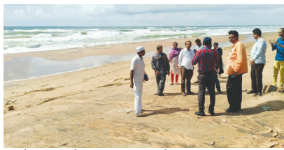
బీతాళపురంలో అలల ఉధృతిని పరిశీలిస్తున్న అధికార బృందం