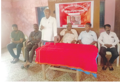
చేపాదని ఈ సందర్భంగా గుర్తు చేశారు. కానీ ఉద్యమం అనేదేని, దేశ మంతా పాకిందని తెలిపారు. మావోయిజాన్ని 2026 నాటికి తీసుకురావడం జరిగింది.