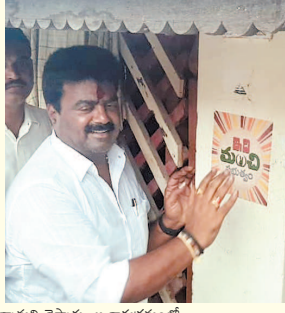
ప్రభుత్వం కట్టబడి ఉందన్నారు. ఎన్నికల ముందు ఇచ్చిన హామీలన్నింటినీ ఒక్కొక్కటిగా అమలు చేస్తున్నామని చెప్పారు. ఆ కార్యక్రమంలో