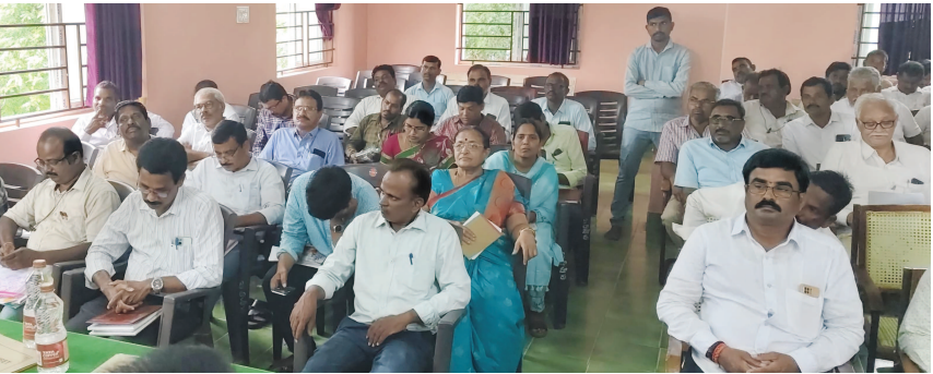
మండల సమావేశానికి హాజరైన సభ్యులు, అధికారులు