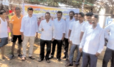
మందన, సెప్టెంబరు 29 (వార్త): మందన మండలంలోని గిరిజనుల భూములు ప్రైవేటు వ్యక్తులు ఆక్రమణలో ఉన్నాయని ప్రభుత్వ జోక్యం చేసుకుని గిరిజనులకు ఆ భూములు ఇప్పించాలని, గిరిజనుల సమస్యలు పరిష్కరించాలని ఆంధ్రప్రదేశ్ గిరిజన అభ్యుదయ సంక్షేమ సంఘం