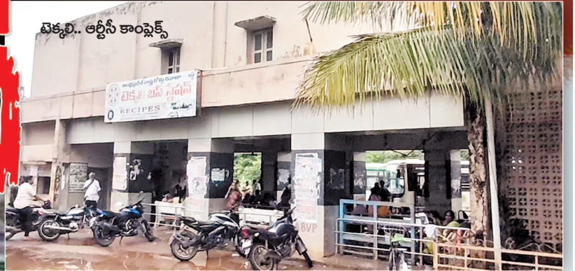
టెక్నో. ఆర్టీసీ కాంప్లెక్స్

* జిల్లాలో శిథిలావస్థకు చేరిన ఆర్టీసీ కాంప్లెక్సులు * ప్రమాదపు అంచున ప్రయాణికులు * పాత భవనాల్లోనే కాంప్లెక్స్ నిర్వహణ * అధికారులకు ఆదాయంపై ఉన్న భద్రతపై లేదన్న విమర్శలు