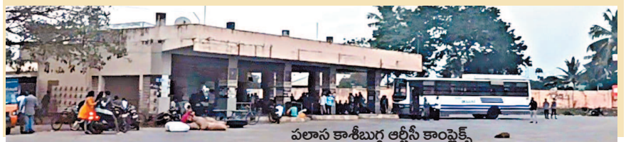
పలాస కాశీబుగ్గ ఆర్టీసీ కాంప్లెక్స్