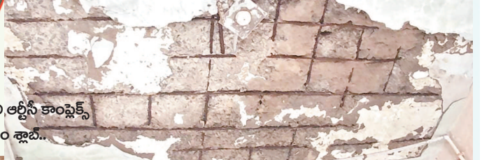
టెక్నో ఆర్టీసీ కాంప్లెక్స్ భవనం ఖాళీ..

* జిల్లాలో శిథిలావస్థకు చేరిన ఆర్టీసీ కాంప్లెక్సులు * ప్రమాదపు అంచున ప్రయాణికులు * పాత భవనాల్లోనే కాంప్లెక్స్ నిర్వహణ * అధికారులకు ఆదాయంపై ఉన్న భద్రతపై లేదన్న విమర్శలు