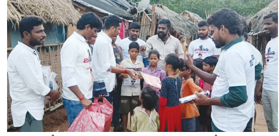
బలియాబాడలో గిరిజన పిల్లలకు దున్నులు, పెన్నులు, పుస్తకాలు అందజేస్తున్న జన సైనికులు