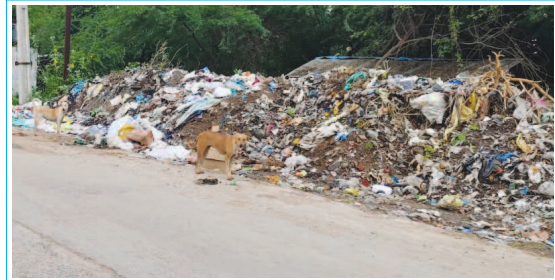
సంతోష్పూర్లో రహదారి పక్కన పేరుకుపోయిన చెత్త

(సంతోష్పూర్-వార్త) సంతోష్పూర్లో పాలు పలు గ్రామాలలో చెత్త నిర్వహణ అస్వస్థ్యంగా సాగుతుందన్న విమర్శలు వెల్లువెత్తుతున్నాయి. చెత్తను వేర్వేరుగా సేకరించి పారిశుధ్య నిర్వహణ చేపట్టాలని అభికారులు పట్టించుకోకపోవడం, పాలకుంబంధి పర్యవేక్షణ లేకపోవడంతో ప్రజలు దుర్వాసనతో సావాసం చేయాలి