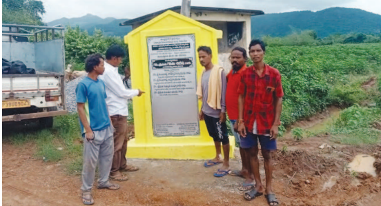
శిలాఫలకాన్ని పరిశీలిస్తున్న జైసీపీ నాయకులు