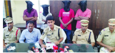
విలేజ్ లలో మార్కెట్ వద్ద ఎస్ఐ కేపీ మహేశ్వర్ రెడ్డి స్టాఫ్ వద్ద గంజాయిని విక్రయిస్తున్న ఆరుగురిని అరెస్టు చేసిపట్టు తెలిపారు.

● ఎస్ఐ కేపీ మహేశ్వర్ రెడ్డి ● ఇచ్చాపురంలో 25 కిలోల గంజాయి పట్టివేత ● ఆరుగురు అరెస్టులు ఇచ్చాపురం, సెప్టెంబరు 9 (వార్త): జిల్లాలో గంజాయిపై ఉక్కుపాదం వ్యాపకంపై ఎస్ఐ కేపీ మహేశ్వర్ రెడ్డి ఆధ్వర్యంలో ఆరుగురు అరెస్టులు జరిగినాయి. సోమవారం ఆయన ఇచ్చాపురం లోని కార్యాలయంలో విలేజ్ లలో మార్కెట్, పురపేక్షం వెళ్లి స్టాఫ్ వద్ద గంజాయిని విక్రయిస్తున్న ఆరుగురిని అరెస్టు చేసిపట్టు తెలిపారు. వీరి వద్ద నుంచి 25.56 కిలోల గంజాయికే పాటు ఒక డిస్కంకూడాను, 7 ముజ్జిల్ ఫోన్లను స్వాధీనం చేసుకు