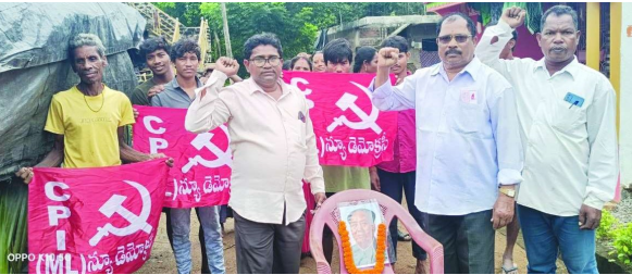
దేశానికి వ్యవసాయక విప్లవమే పం ప్లార మార్గం అన్నారు. మావో ఆలోచనా సిద్ధాంత విప్లవం విలయవంతంకోసం కామ్రేడ్ మావోకి నివాళులర్పించిన వాళ్ళవారమన్నారు. మావో ఆలోచనా సిద్ధాంత విప్లవం విలయవంతంకోసం