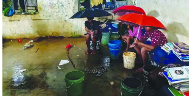
వాననీడలేని తడుస్తున్న వైద్యం. ఒకే భవనంలో తలదాచుకుంటున్న పరిస్థితి

■ వాన నీడలేని తడుస్తున్న వైద్యం ■ ఒకే భవనంలో తలదాచుకుంటున్న పరిస్థితి