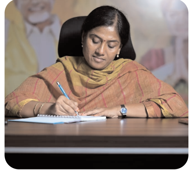
చంద్రబాబుకు ప్రతి ఒక్కరు సహాయ సహకారాలు చేయాలని కోరారు.

పలాస, సెప్టెంబర్ 10 (వార్త): తుఫాను తాకిడికి విలవిల లాడుతున్న విజయవాడ వరద బాధితులకు తన ఆగస్టు నెల వేతనాన్ని విరాళంగా వలాస ఎమ్మెల్యే గౌతు శిరీష ప్రకటించారు. వరద బాధిత ప్రాంతాల కోలుకోవడానికి ముఖ్యమంత్రి రాత్రింబవళ్ళు కష్టపడుతున్నారని, తన వంతు సహకారం అందజేయడం బాధ్యతగా భావిస్తున్నాను పేర్కొన్నారు. మానవత్వ విలువలతో ప్రతి ఒక్కరూ దాతృత్వం చూపించాల్సిన సమయం వచ్చిందని ప్రజలను కోరారు. ఆహార్నిసలు బాధితుల సంక్షేమానికై కష్టపడుతున్న ముఖ్యమంత్రి