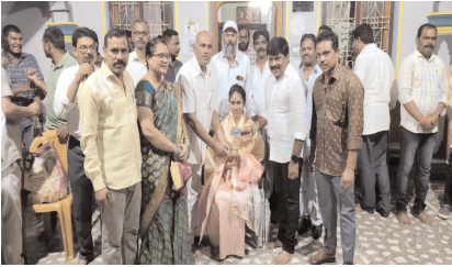
పాతపట్నం, అక్టోబర్ 01, (వార్త): సీట్-యూజ్ ప్రవేశ పరీక్ష 2024లో రాంకు సంపాదించి, ఎం.బి.బి.ఎస్ వైద్య విద్యలో సీటు సంపాదించిన