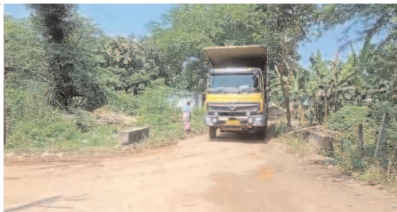
అనుకను బొట్టిలి గ్రోత్ సెంటర్ వద్ద దంపి చేస్తున్నట్లు సమాచారం. అనుక తరలింపు మొదలవడంతో కొండచాకరాపల్లి గ్రామస్థులు మండిపడుతున్నారు.

వంగర, అక్టోబర్ 1 (వార్త): వంగర మండలంలో కొండ చాకరాపల్లి గ్రామం వద్ద సువర్ణ ముఖీ నదిలో నుండి అనుక పేరకపలు మొదలయ్యాయి. గత ఆర్రులాది నుండి ఇప్పటి నుండి అనుకను తరలిస్తున్నారు. ఈ మేరకు కొండ చాకరాపల్లి గ్రామస్థులు వెళ్లడంవల్ల కొండ చాకరాపల్లి గ్రామస్థులు రక్షణ గోడ నిర్మించాలని జిల్లా అధికారులను పదే, పదే కోసినప్పటికీ పట్టించుకున్నట్లు కనిపించే పరిస్థితి లేదు. సువర్ణ ముఖీనదిలో అనుక రీట్ ఏర్పాటు పనులు ముమ్మరంగా ఇటీవల చేసి ఇప్పుడు శ్రీపద్మలో అనుకను తరలిస్తున్నారు. ఈ కొండ చాకరాపల్లి నుండి సువర్ణముఖీనది కొత్త అనుక రీట్ నుండి సుమారుగా 75 వేల మెట్రిక్ టన్నుల అనుకను తరలించనున్నట్లు జిల్లా అధికారులు వెల్లడించిన విషయం తెలిసింది. ప్రస్తుతం అనుక తరలింపును మొదలు పెట్టారు. ఈ