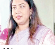
టీడీపీ సోషల్ మీడియా