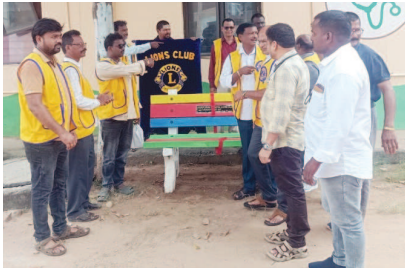
హరిపురం సీహెచ్‌సీకి సిమెంట్ బెంచీలు అందజేస్తున్న లయన్స్ క్లబ్ ప్రతినిధులు

■ ఆసుపత్రికి సిమెంట్ బెంచీల వితరణ ■ 108 సిబ్బందికి ఘన సన్మానం