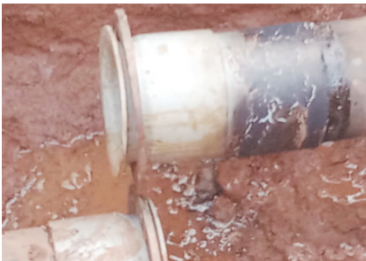
పూర్తిగా పాడైయ్యిందో, మూడు రోజుల క్రితం అదే చోట ప్రధాన పైపు లైన్లు పాడైంది. దీంతో మండలంలో కొద్దిక, బలంగా వలన, ఎం.సి.కాంపౌండ్లకు, ముగ్గురు, లక్ష్మీపేట, కొవ్వపల్లవ, కొత్తవలన, కొండ రాకరాపల్లి, కొవ్వపల్లవ తదితర గ్రామాలకు మంచినీటి సరఫరా నిలిచిపోయింది. దీంతో మంచి నీటి కోసం ఆయా గ్రామాల ప్రజలు తీవ్ర ఇబ్బందులకు గురవుతున్నారని ఆందోళన చెందుతున్నారు. ఎం.సి.కాంపౌండ్ల వద్ద పాడైన పైపు లైన్లకు వెంటనే మరమ్మత్తులు చేపట్టి మంచి నీటి సరఫరా అంతరాయం కలుగకుండా చర్యలు తీసుకోవాలని సంబంధిత అధికారులను ఆయా గ్రామాల ప్రజలు డిమాండ్ చేస్తున్నారు. వెంటనే ఆరేడబ్బాసిన అధికారులు ప్రధాన పైపు లైన్లకు సరైన మరమ్మత్తులు చేపట్టి ఆయా గ్రామాల ప్రజలకు తగు సరఫరా అయ్యేటట్లు మూడూని కోరుతున్నారు.

పంగర, అక్టోబర్ 27(వార్డు): మగ్గూరు పైవలైన్ కు నెల రోజుల్లోనే రెండు సార్లు ఒకే చోట లీకులు ఏర్పడడంతో సంబంధిత అధికారులు ఈ పనుల్లో ఎంత నాణ్యత పాటిస్తున్నారో సస్య ఆలోచనలు వెళ్లవల్సివచ్చాయి. మూడు దినాలుగా మంచి నీటి సరఫరా లేదు గ్రామాలకు నిలిచిపోయింది. పంగర మండలంలోని మగ్గూరు వద్ద ఉన్న మంచినీటి వనరుల నుంచి అన్ని గ్రామాలకు ప్రధాన పైపు లైన్లు ఉన్న విషయం తెలిసిందే. ఈ పైపు లైన్లకు ఎం.సి.కాంపౌండ్ల గ్రామంవద్ద ప్రధాన పైపు లైన్లకు లీకులు ఏర్పాటు కావడంతో అనేక గ్రామాలకు నీటి సరఫరా నిలిచిపోయింది. ఎం.సి.కాంపౌండ్లలో మంచి నీటిపైపు లైన్లకు ఒకే చోట గత నెల దినాల కంటే ఎక్కువైన పైపు లైన్