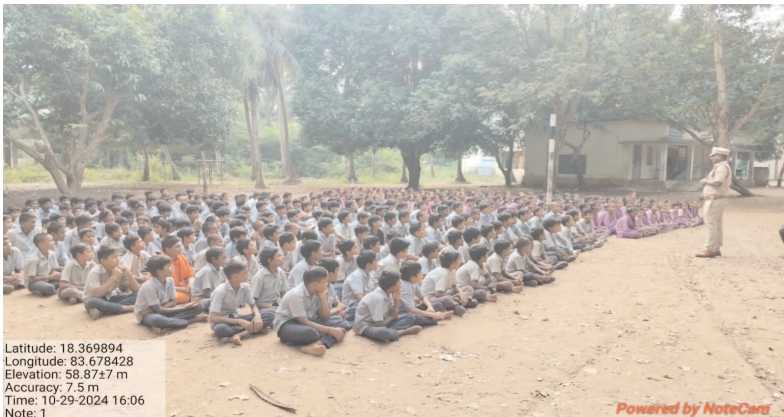
Latitude: 18.369894 Longitude: 83.678428 Elevation: 58.87±7 m Accuracy: 7.5 m Time: 10-29-2024 16:06