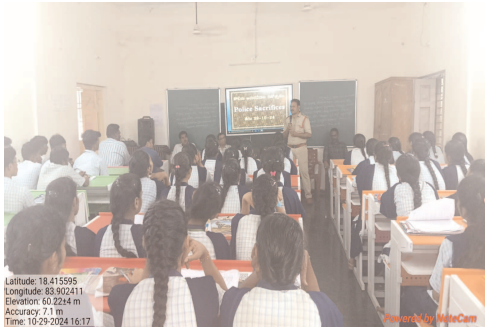
Latitude: 18.415595 Longitude: 83.902411 Elevation: 60.2224 m Accuracy: 7.1 m Time: 10-29-2024 16:17