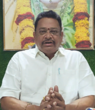
తీసుకోవాలి ఎవరైనా మద్యం దుకాణాన్ని ఉపసంహరించాలి.

చేస్తే లైసెన్సు రద్దు చేస్తామన్నారు. సామాన్య ప్రజలకు నష్టమైన మద్యాన్ని అందించాలని ఉద్దేశంతో ఈ నూతన మద్యం పాలసీని చేపట్టింపారు. ప్రజలకు ఏ ఆటంకాలు ఏర్పడకుండా వ్యాపారాలు చేయాలని సూచించారు. మద్యం దుకాణాల్లో ఎమ్మార్వీ కంటే అధిక ధరలకి అమ్మకం చేపట్టినా, గ్రామాల్లో రైల్వే షాపులు నిర్వహించినా వెంటనే ప్రభుత్వ అధికారుల దృష్టికి తమ దృష్టికి తీసుకురావాలని ప్రజలకు సూచించారు. రాష్ట్ర ప్రభుత్వానికి, తెలుగుదేశం పార్టీకి చెప్పడమే