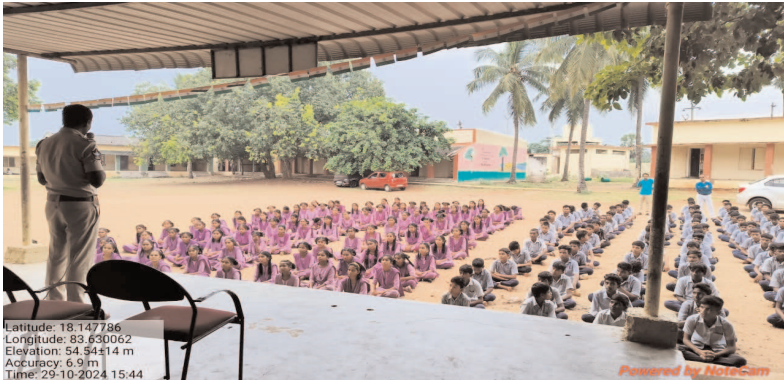
Latitude: 18.147786 Longitude: 83.630062 Elevation: 54.54±14 m Accuracy: 6.9 m Time: 29-10-2024 15:44