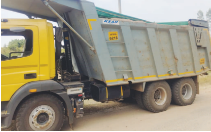
నువ్వరముఖి నదులోని రేవుల వద్ద నుంచి పెద్దమొత్తంలో ట్రాక్టర్లతో అక్రమ ఇసుక తరలింపును సంగఠి అందరికీ తెలిసింది. భారీ వాహనా

పంగన, నవంబర్ 17(వార్త): పంగన మండలంలోని తలగాం గ్రామం వద్ద గల నాగావలి నది నుంచి ప్రాంత వర్ష లో అక్రమంగా ఇసుక తరలింపు చేస్తున్నారు. పట్టణంలో ఈ అక్రమ రవాణా సాగుతుండడం గమనించారు. ఇదే రేవు నుంచి లారీలతో అక్రమంగా ఇసుక తరలింపుగా అక్టోబర్ 2న పోలీసులు పట్టుకోవడానికి తెలిసింది. అప్పటి నుంచి కచ్చితంగా అక్రమ రేవులను పట్టి విజృంభించారు. ఇంత యత్నాన్ని ఇసుకను తరలింపడంలో ఎవరి పాపం ఉందో అని మండల వాసులు గుసగుసలాడుతుంటున్నారు. మండలంలో ఉన్న వేగావలి, నాగావలి,