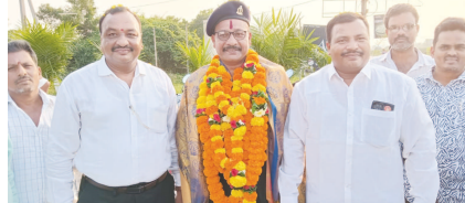
పురుషోత్తంపేట సన్మానిస్తున్న గ్రామస్థులు