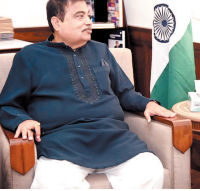
కలయకనున్నారు. ఈ సందర్భంగా దేశంలోనే అతి పూరాతన, ఏకైక సూర్య దేవాలయం అరసవల్లి అలయ చరిత్ర, విశిష్టత, వాస్తవ వైపులు, అభివృద్ధి అవకాశాలను చర్చించారు. చారిత్రకంగా 7వ శతాబ్దంలో నిర్మితమైన ఈ

జిల్లాలోని ప్రముఖ సూర్య దేవాలయం అరసవల్లిని హార్వర్డ్ ఫైన్ అమలుతో నమగ్రంగా అభివృద్ధి చేయాలని కేంద్ర పౌర విమానయాన శాఖ మంత్రి కింజలాపు రామ్మోహన్ కొరారు. ఏలూ అంధ్రప్రదేశ్ తోపాటు తెలంగాణ, ఒడిశా, పశ్చిమ గోదావరి రాష్ట్రాలకు చెందిన లక్షలాది మంది భక్తులు స్వామివారి దర్శనాలకు వస్తుంటారని, దీనిని అనుసరించి కేంద్ర ప్రభుత్వ పథకం కింద కేంద్ర ప్రభుత్వం నుంచి రాష్ట్రానికి రూ.113.75 కోట్ల మూలధనమందనపు కేంద్ర మంత్రి రామ్మోహన్ నాయుడు హర్వర్డ్ వ్యక్తం చేశారు. అంధ్రప్రదేశ్ అభివృద్ధిని ముందుకు నడిపించడంలో పాటు ప్రజా సంక్షేమానికి అంకితభావంతో కృషి చేస్తున్న ప్రధానమంత్రి నరేంద్రమోడి, ముఖ్యమంత్రి చంద్రబాబు నాయుడు మార్గదర్శకత్వంలో శ్రీకాకుళం జిల్లాను అన్న రంగాలో ముందంజలో నిలిపేందుకు తన వంతు పాత్ర పోషిస్తామి స్పష్టం చేశారు.