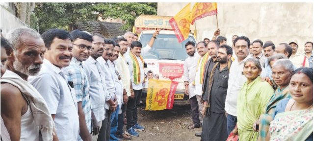
పాతపట్నం, నవంబర్ 3(వార్త): పాతపట్నంలోని దువ్వార వీధిలో నూవర్ సిక్స్ హోమ్లో భాగంగా