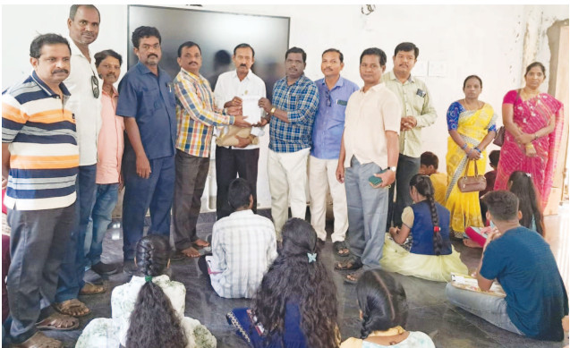
పాతపట్నం, నవంబర్ 3(వార్త): గణిత ఉపాధ్యాయుల ఛోరం ఆధ్వర్యం

లో పాతపట్నం మండలంలోని ప్రభుత్వ పాఠశాలలకు చెందిన ఎనిమిది, తొమ్మిది, పదో తరగతి విద్యార్థులకు గణిత ప్రతిభా పరీక్షను అడివారం స్థానిక