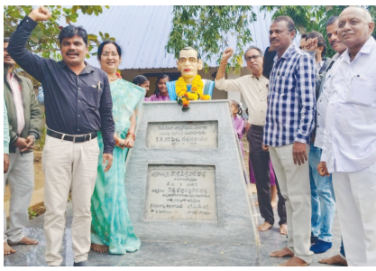
జిల్లాకు గరిమెళ్ల పేరు సమీకరించాలని డిమాండ్ చేశారు. ఆయన మాట్లాడుతూ భారత స్వాతంత్ర్య పోరాటంలో శ్రీకాకుళం జిల్లాకు సమీకరించాలని డిమాండ్ చేశారు.