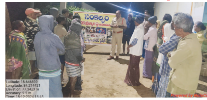
Latitude: 16.646099 Longitude: 84.214421 Elevation: 73.9457 m Accuracy: 9.8 m Date: 18-12-2024 11:45

వ్యక్తం ఉండాలని తెలిపారు. కార్యక్రమంలో ఆ గ్రామ ప్రజలు, యువకులు పాల్గొన్నారు.