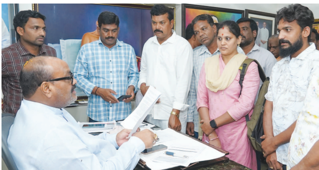
లని ప్రజలు వినతులు అందజేశారు. అందాయి. కార్యక్రమంలో పాతపల్లం ఎమ్మెల్యే మామిడి గోవిందరావు, తిక్కలి, సంతోష్ మూర్తి, కోటబొమ్మలె, నందిగాం, మండలాలకు చెందిన నాయకులు, కార్యకర్తలు పాల్గొన్నారు.

తిక్కలి, డిసెంబర్ 1(వార్త): నిమ్మూడ లోని మంత్రి క్యాంపు కార్యాలయంలో ఆదివారం నిర్వహించిన ప్రజా వేదికకు వినతుల వెల్లువైతాయి. మంత్రి కింజ రావు ఆహ్వానముగా ప్రజల నుంచి వినతులు స్వీకరించారు. ఈ సందర్భం గా ఆయన మాట్లాడుతూ ప్రజా సమ స్థల పరిష్కారానికి కృషి చేస్తామన్నారు. వివిధ శాఖల అధికారులతో మాట్లాడి సమస్యలు పరిష్కరించాలని ఆదేశించారు. జనవరి నుంచి నూతన పింఛన్లు మంజూరు చేస్తామని తెలిపారు. నూతన ఇళ్లు, జనవరీలో కొత్త పింఛన్లు మంజూరుకు ఆర్డర్లు అధి కారులు తమ గ్రామంలో పర్చుకునిన పుస్తక వివరాలు అందజేయాలని ఆయ న సూచించారు. ప్రతి గ్రామానికి అధి కారులు వచ్చి యాచ్మో వివరాలు సమారు చేసుకుంటారని తెలిపారు. ఉద్యోగి, ఉపాధి అవకాశాలు కల్పించా