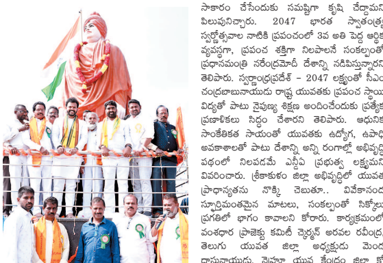
దేశానికి మాత్రమే ఉంది కేంద్ర మంత్రి రామ్మోహన్ నాయుడు గుర్తు తెచ్చారు. డీసీసీ సర్దిబియ్యం చేసుకోవడంతో పాటు వికసిత భారత్ లక్ష్యాన్ని