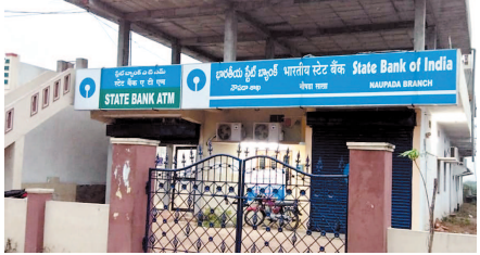
గొడవలు చేయడం వల్ల భాతాదారులకు, బ్యాంకు సిబ్బందికి ఇబ్బంది కలుగుతుందని, ఏమైనా సమస్య ఉంటే ఫోటో తనిఖీలను వచ్చి ఫిర్యాదు చేసుకోవాలని సర్పంచి సీఎఫ్ భర్తను, కుమార్తెను బయటికి పంపించేశారు.

నిలదీసిన ఓ వెలుగు సీఎఫ్ భర్త, కుమార్తె సంకటావస్థలో, ఫిబ్రవరి 1 (వార్త): అనర్హుని అనధికారం చేసుకుని తన పక్షం వేసి మహిళలపై క్రిమినల్ కేసులు పెట్టడంపై నోడల్ ఎంపీల మేనేజర్ వెకిలి చేష్టలు వెలుగులోకి వచ్చాయి. వివరాలకు సంబంధించిన నోడల్ ఎంపీల కేసులపై అధిక సంఖ్యలో వచ్చిన ఫిర్యాదులతో బ్యాంకు సిబ్బంది తమతమ పనుల్లో బీజీగా ఉన్నారు. ఒక్కసారిగా బ్యాంక్ మేనేజర్ క్యాబిన్ లో అరుపులు, కేలు వినిపించాయి. బ్యాంకులో ఉన్న భాతాదారులకు, ఇతర బ్యాంకు సిబ్బందికి ఏమైందో కచ్చితంగా చెప్పలేక పరక ఆర్డర్ కాలేదు. ఓ వెలుగు సీఎఫ్ భర్త, ఆమె కుమార్తె కలిసి బ్యాంక్ మేనేజర్ ను నిలదీయడం కనిపించింది. ఎంతమంది సిబ్బందీ తమింతో అడుకుంటూ, సెల్ ఫోన్ లో చాటింగులు చేస్తున్నారంటే అంటూ ప్రశ్నించారు. మరోపక్క సున్న మా అమ్మతో ఇలాంటి పనులు చేయడం వల్ల నా భవిష్యత్తు ఏమవుతుందో అర్థం కావడం లేదు అంటూ సీఎఫ్ కుమార్తె బ్యాంకు మేనేజర్ ను గద్దెగా నిలదీసింది. ఈ గొడవ బయటకున్న సమయంలో బ్యాంకు పనిమీద ఫోటో తనిఖీలతో రావడంతో జరిగిన విషయాన్ని అడిగి తెలుసుకున్నారు. బ్యాంకు పని చేశాల్సి ఇలాంటి