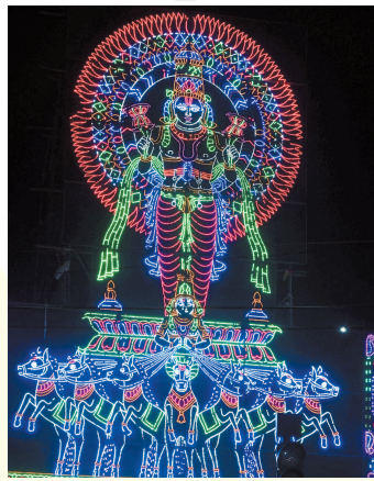
శ్రీకాకుళం, ఫిబ్రవరి 1 (వార్త): అరసవల్లి సూర్యనారాయణ స్వామి జయంతి వేడుకలకు రథసప్తమి సందర్భంగా మూడు రోజుల పాటు కమల విందుగా జరగనున్నాయి. ఈ సందర్భంగా పలు సాంస్కృతిక, ఆధ్యాత్మిక కార్యక్రమాలకు జిల్లా యంత్రాంగం ఏర్పాట్లు చేసింది. తొలిరోజు ఆదివారం ఉదయం 6 గంటలకు సామూహిక సూర్య నమస్కారాలతో ఉత్సాహం చూపుతున్నారు.

అరసవల్లి సూర్యనారాయణ స్వామి రథసప్తమి సందర్భంగా ఈనెల మూడవ తేదీ ఆర్ధరాత్రి నుంచి స్వామి వారి నిజరూప దర్శనం కమల విందు చేయనుంది. ఈ సందర్భంగా భక్తుల సౌకర్యార్థం, రద్దీని క్రమబద్ధీకరించే చర్యలలో భాగంగా వివిధ రకాల టికెట్లను అందుబాటులో ఉంచామని జిల్లా రెవెన్యూ అధికారి తెలిపారు. రూ. 100, రూ.300, రూ.500 దర్శన టికెట్లు అరసవల్లి దేవాలయ ప్రాంగణంలోని కౌంటర్లో లభిస్తాయి. 4వ తేదీ ఉదయం ఒంటిగంట నుంచి ఉదయం ఆరు గంటల వరకు టికెట్ల విక్రయం చేస్తున్నారు.