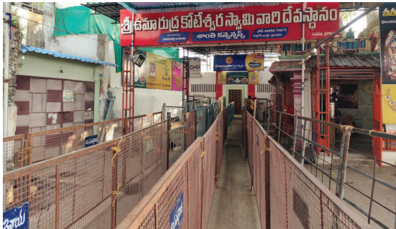
వంట స్వామివారిని సష్ట వాహనంపై ఉత్సాహం జరుగుతుంది.

శ్రీకాకుళం, ఫిబ్రవరి 25(వార్త): శ్రీకాకుళంలో సుప్రసిద్ధ శైవ క్షేత్రమైన శ్రీ శివారూద్ర కోటేశ్వరస్వామి దేవాలయం మహాశివరాత్రి ఉత్సవాలకు ముస్తాబైంది. నామవలీ నది ఒడ్డున ఉన్న శ్రీ శివారూద్ర కోటేశ్వర స్వామి ఆలయంలో శివరాత్రి పర్వదినాన్ని పురస్కరించుకొని ఉదయం మూడు గంటలకు ప్రధానార్చన సహిత వందామృతాభిషేకం, నాలుగు గంటల నుంచి భక్తుల కోసం అభిషేకం, అర్చన, దర్శనములు ప్రారంభం అయ్యాయి.