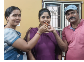
సందర్భంగా తెలియజేశారు ఇండియన్ ఇంజనీరింగ్ సర్వీసులో ర్యాంకు సాధించిన తన తన అని అమె తెలియజేశారు.